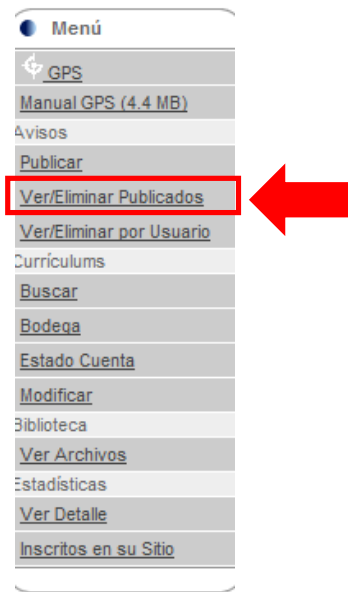
Figura 1: Ver/Eliminar avisos publicados.

Debemos hacer clic en la opción “ Ver/Eliminar Publicados ”, como muestra la Figura 1 .