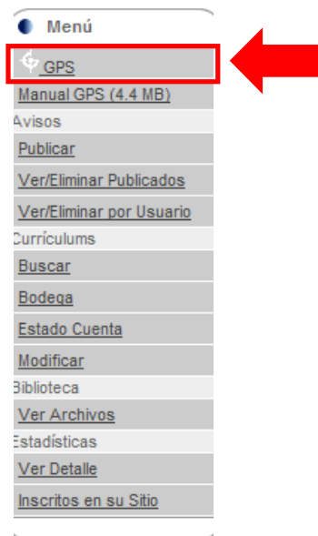
Figura 1: GPS.

Para comenzar haga clic en “GPS”. Como muestra la Figura 1 .