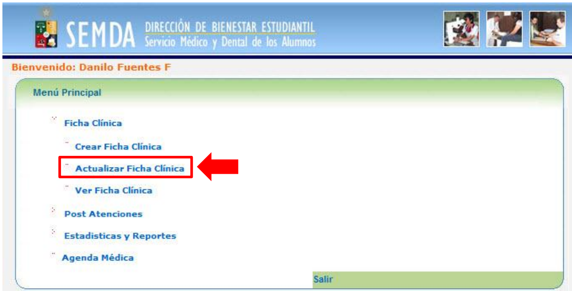
Figura 1: Menú principal.

Haga clic sobre “Ficha Clínica > Actualizar Ficha Clínica” , tal como lo muestra la Figura 1 .