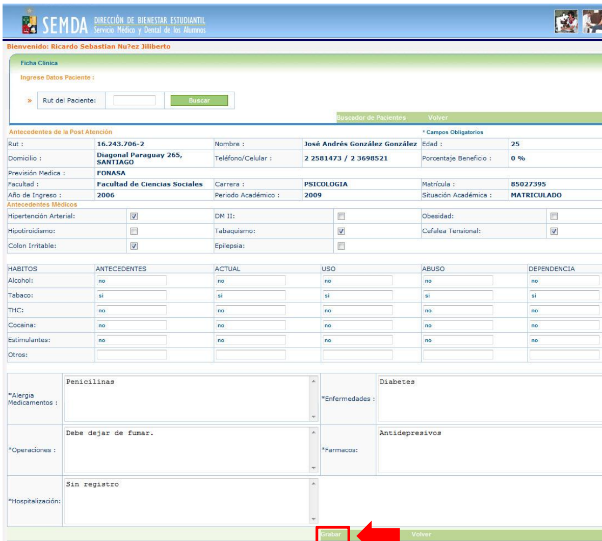
Figura 3: Ingreso de nuevos datos en la ficha clínica.

En este ejemplo, se modificará la ficha clínica ingresando fármacos que no habían sido declarados anteriormente, una vez completados los campos debe hacer clic sobre “Grabar” , tal como se muestra en la Figura 3 .