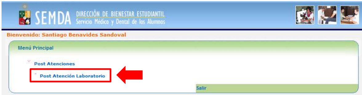
Figura 1: Menú principal.

Haga clic sobre “Post Atenciones > Post Atención Laboratorio” , tal como lo muestra la Figura 1 .