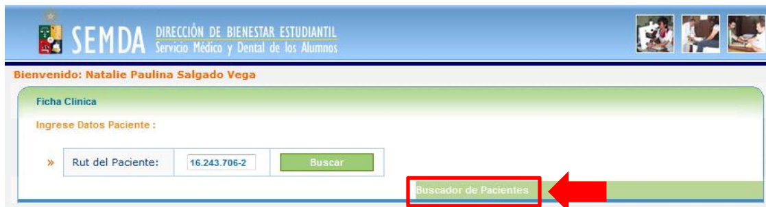
Figura 3: Buscar por Rut.

- Por Rut: Esta es la búsqueda por defecto. Aquí ingresamos el Rut del paciente, sin puntos ni guiones, y luego presionamos en el botón “Buscar” , tal como lo detalla la Figura 3 .