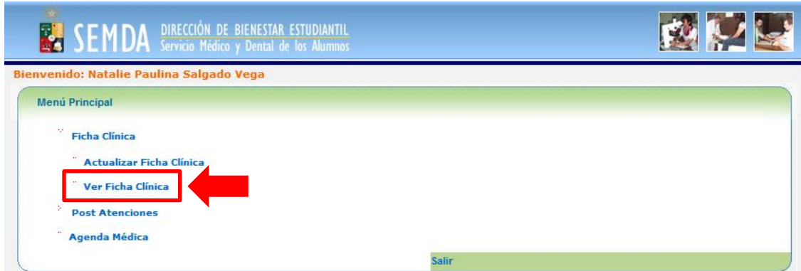
Figura 1: Menú principal.

En este capítulo realizaremos un ejercicio detallando los pasos para visualizar una Ficha Clínica. Haga clic sobre “Ficha Clínica > Ver Ficha Clínica” , tal como muestra la Figura 1 .